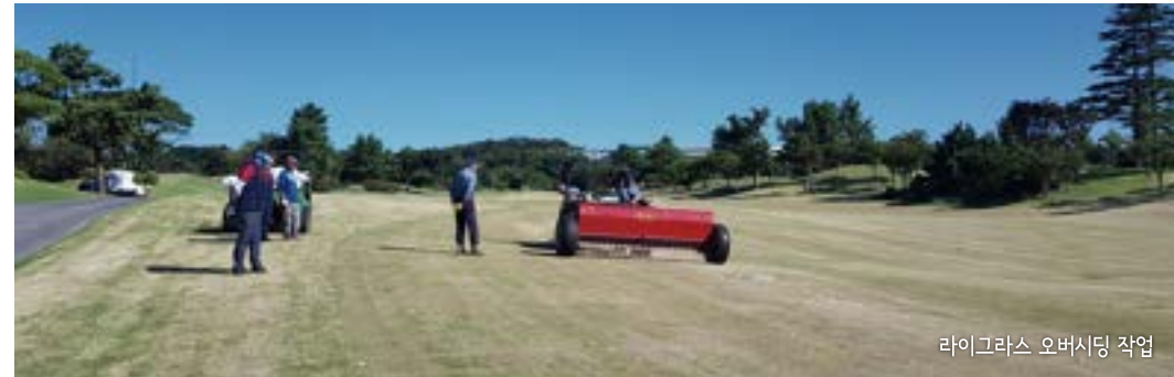
라이그라스 오버시딩 작업